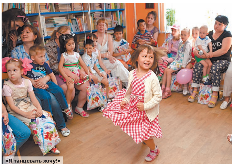
«Я танцевать хочу!»