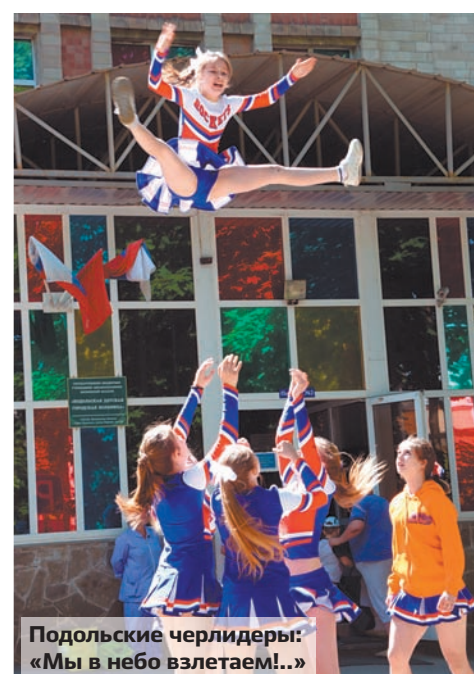
Подольские черлидеры: «Мы в небо взлетаем!..»