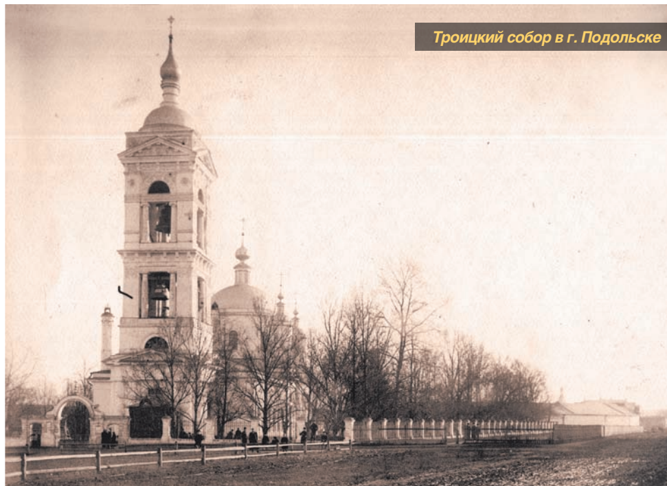
Троицкий собор в г. Подольске

12 июля 1912 года руководитель свиты его величества генерал-майор В.Ф. Джунковский, московский губернатор, разослал председателям уездных земских управ, городским головам и старостам городов и посадов Московской губернии письмо следующего содержания: