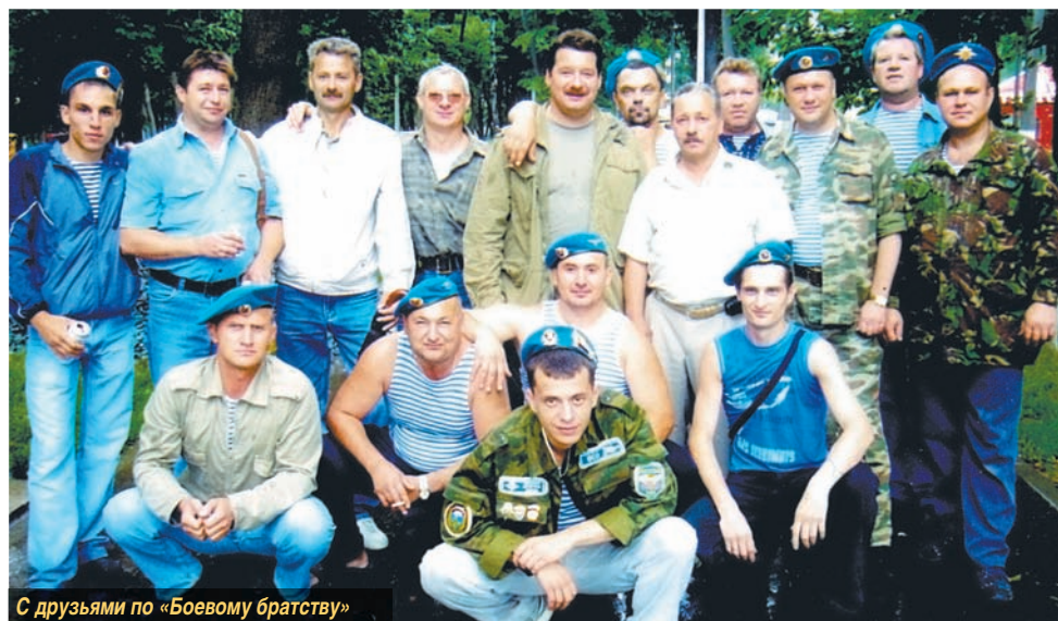
С друзьями по «Боевому братству»

Беседовал Алексей ЛУБИНСКИЙ.