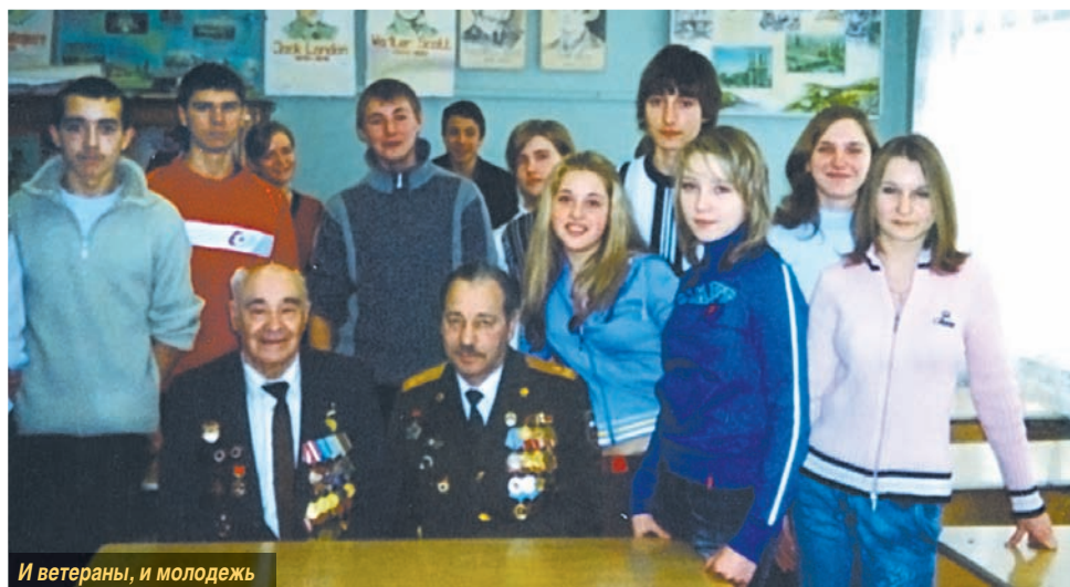
И ветераны, и молодежь

– Мечты сбываются! Может быть, и наша река Пахра когда-нибудь обретет свое былое великолепие?