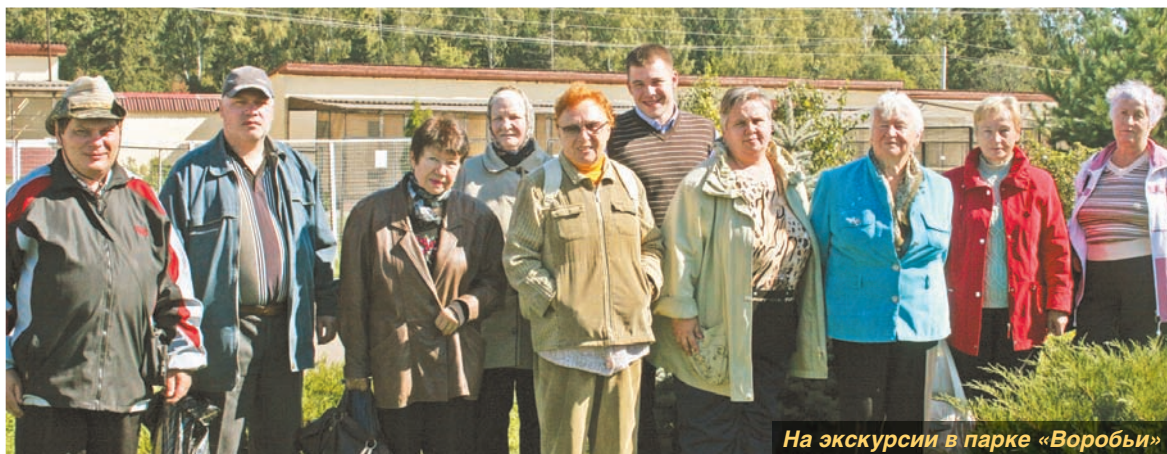
На экскурсии в парке «Воробьи»