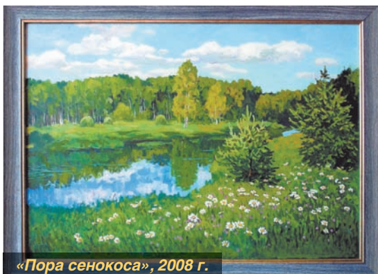
«Пора сенокоса», 2008 г.