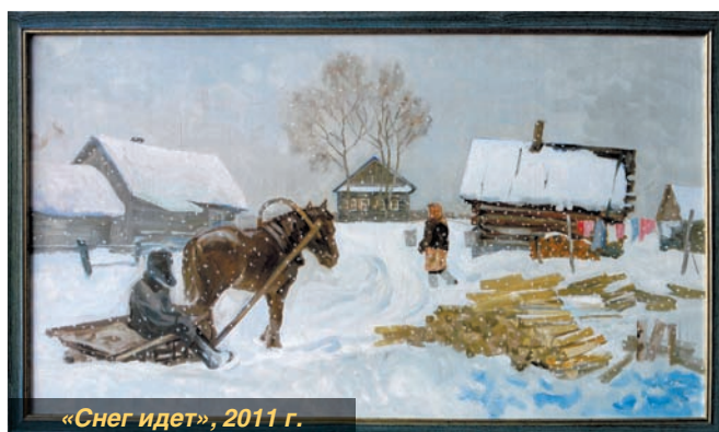
«Снег идет», 2011 г.