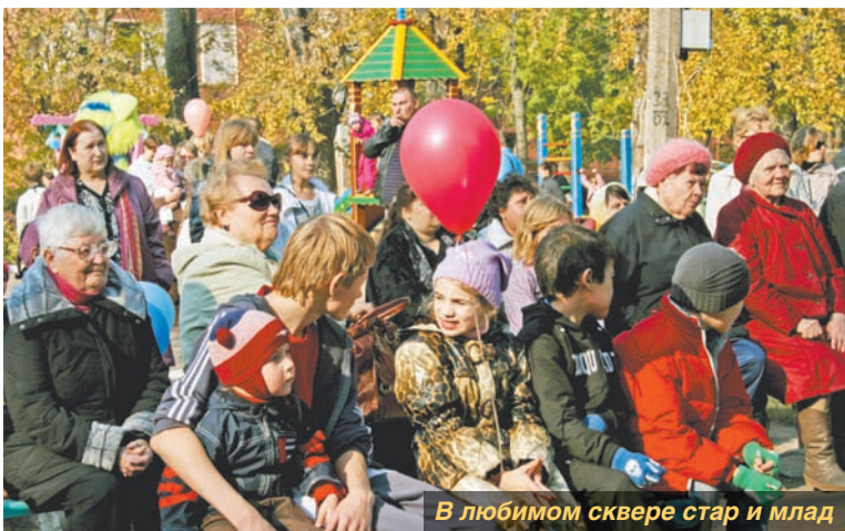
В любимом сквере стар и млад

Беседовала Н. РЖЕВСКАЯ.