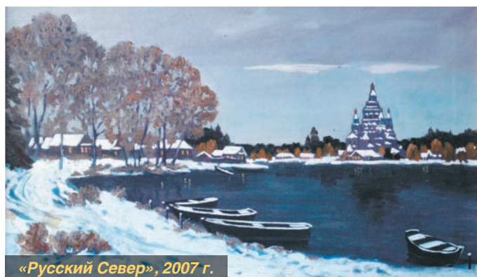
«Русский Север», 2007 г.