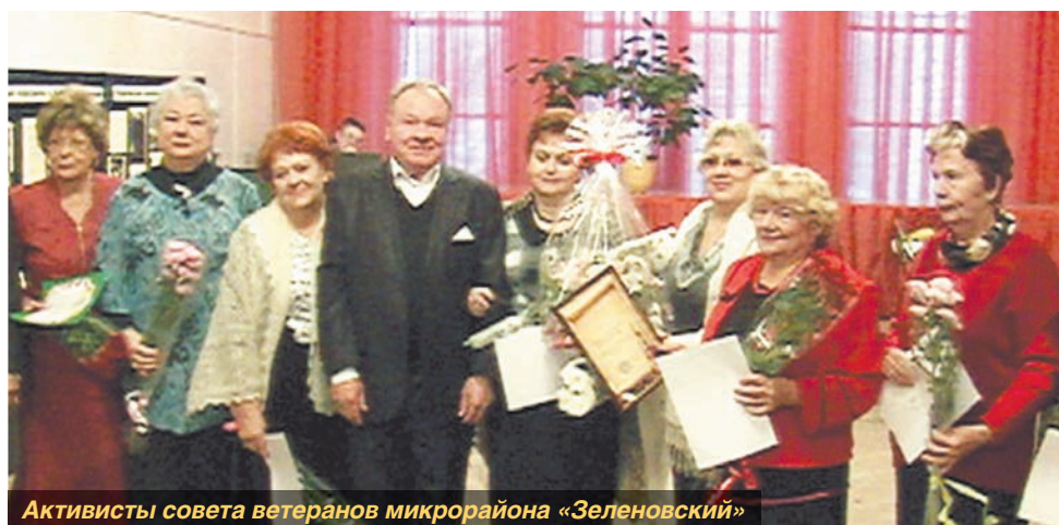
Активисты совета ветеранов микрорайона «Зеленовский»