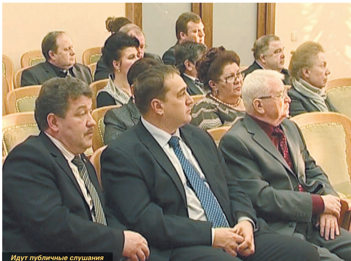
Идут публичные слушания