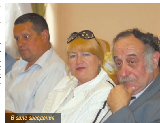
В зале заседания

В соответствии с Федеральным законом от 06.10.2003 г. № 131-ФЗ «Об общих принципах организации местного самоуправления в Российской Федерации», Законом Российской Федерации от 10.07.1992 г. № 3266-1 «Об образовании», Уставом муниципального образования «городской округ Подольск Московской области» одобрена концепция развития дошкольного образования