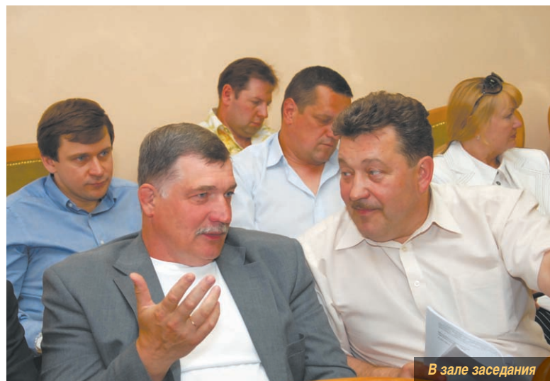
В зале заседания