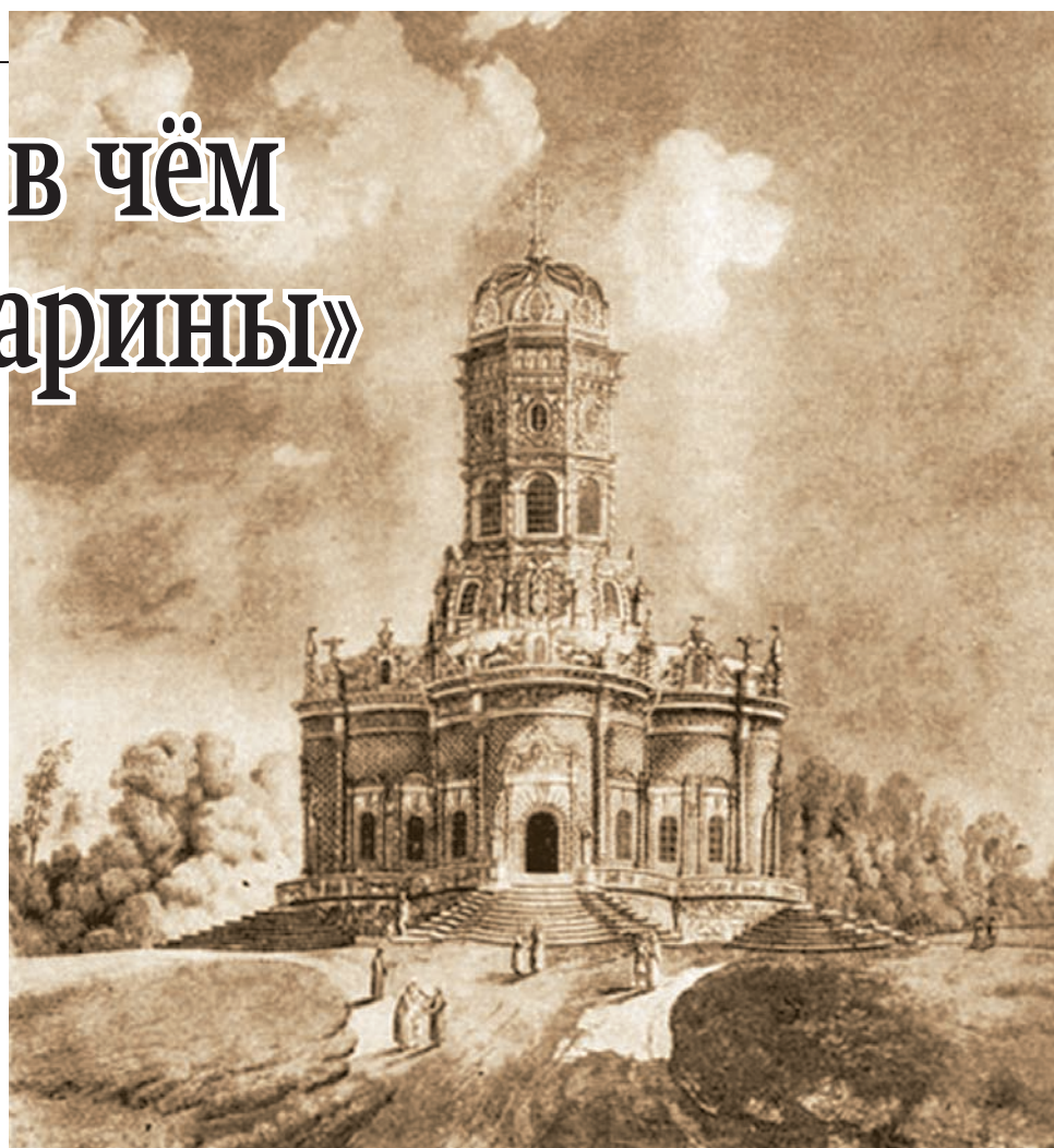
Общий вид церкви Знамения в усадьбе Дубровицы. Гравюра И.К. Набгольца по оригиналу С. Ф. Щедрина, между 1784 и 1797 гг. Государственный музей изобразительных искусств им. А. С. Пушкина.