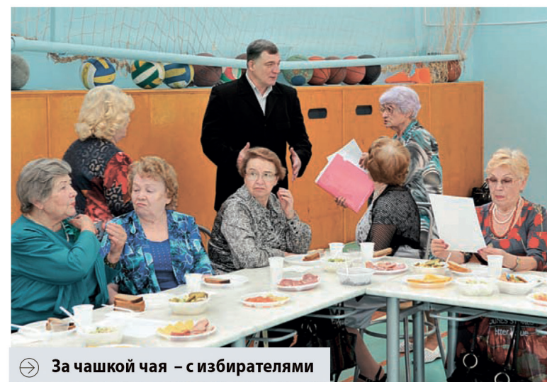
➔ За чашкой чая – с избирателями

Важно АДРЕС И ДАТА ПРИЁМА: ■ г. Подольск, ул. Высотная, д. 17 (школа № 17) – 2-й и 3-й четверг каждого месяца с 18.00 до 20.00.