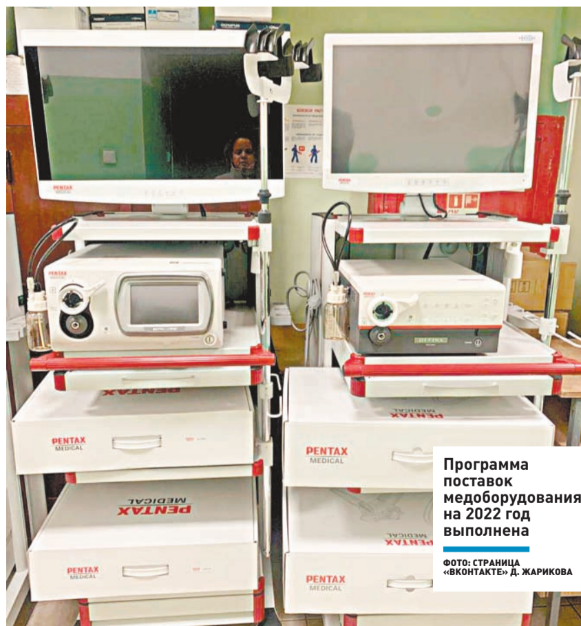
Программа поставок медоборудования на 2022 год выполнена