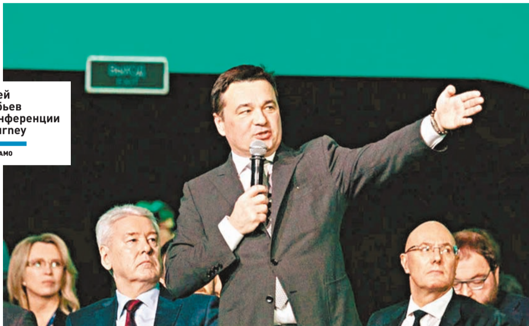
Андрей Воробьев на конференции AI Journey