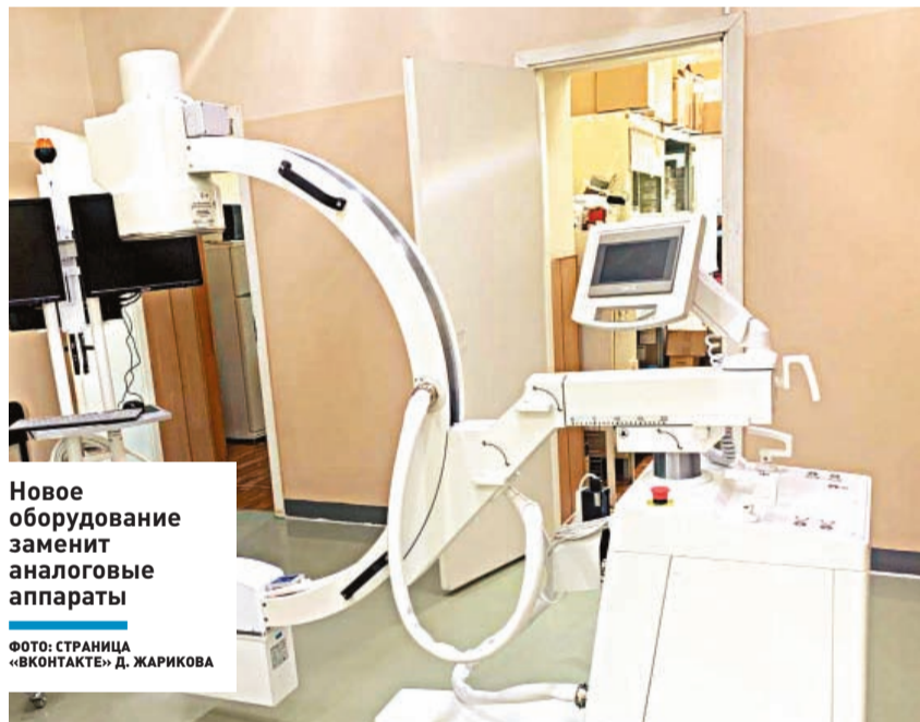
Новое оборудование заменит аналоговые аппараты