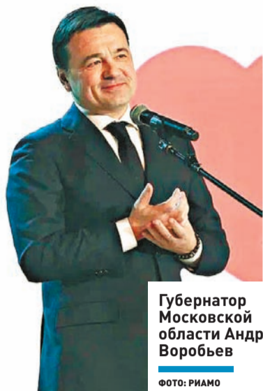
Губернатор Московской области Андрей Воробьев