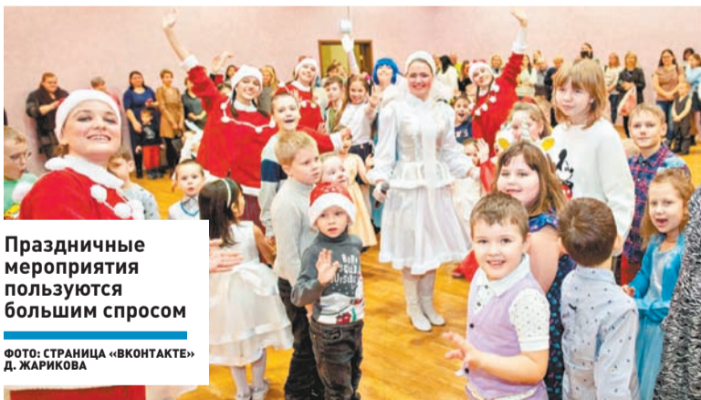
Праздничные мероприятия пользуются большим спросом