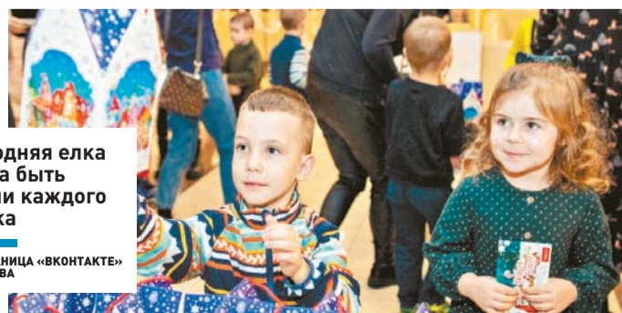
Новогодняя елка должна быть в жизни каждого ребенка

Во Дворце культуры «Октябрь» 20 воспитанников Подольского социально-реабилитационного центра для несовершеннолетних «Радуга» ждало настоящее интерактивное представление. Для ребят из малообеспеченных семей артисты ДК «Октябрь» подготовили новогод-