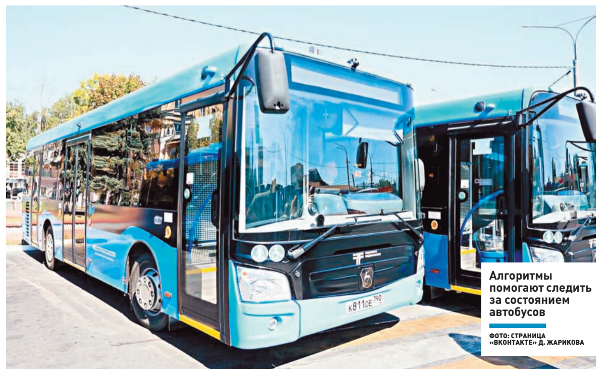
Алгоритмы помогают следить за состоянием автобусов

зафиксировано в городском округе Подольск при помощи умных камер видеонаблюдения в этом году