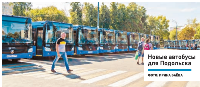
Новые автобусы для Подольска