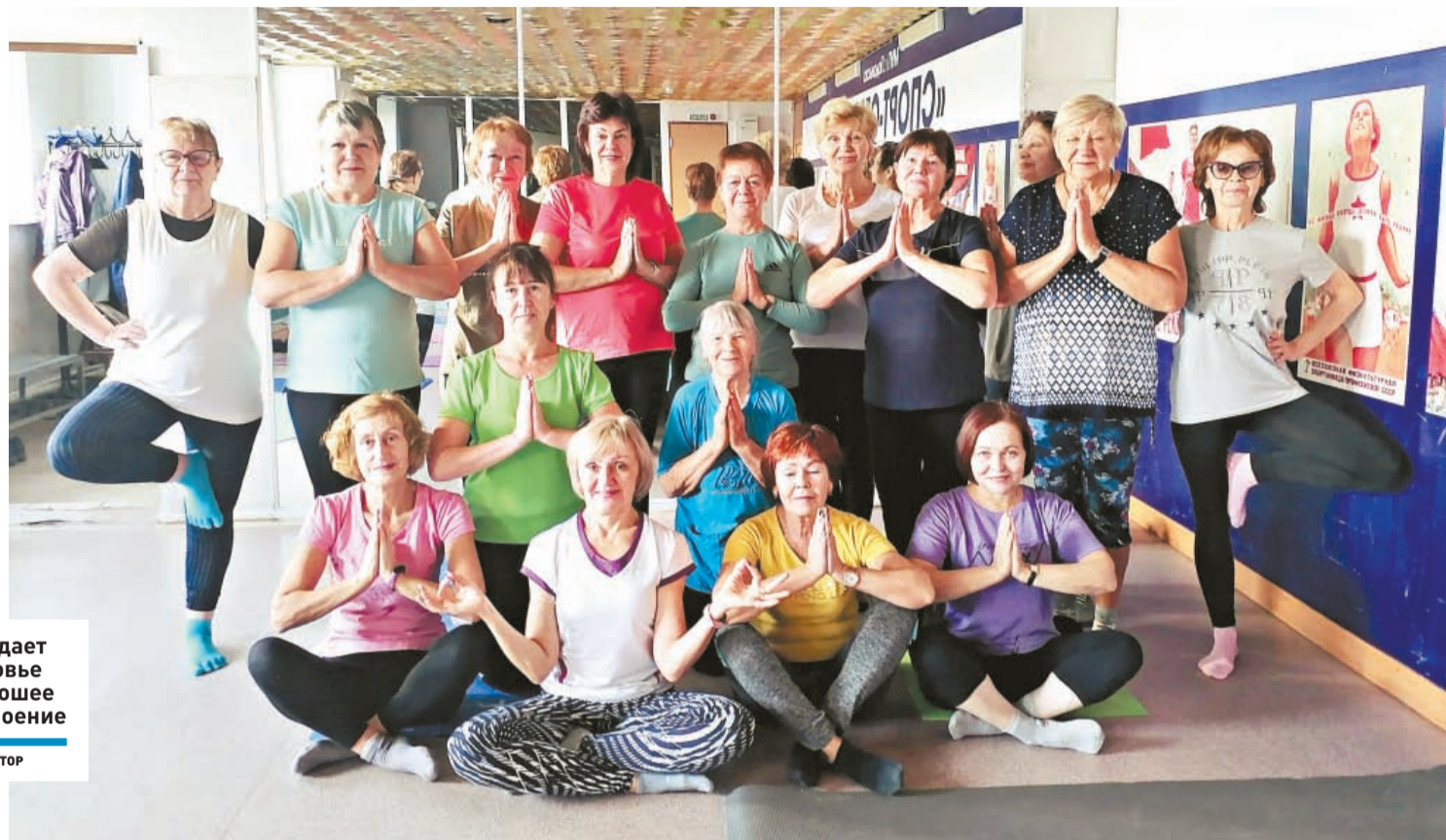
Йога дает здоровье и хорошее настроение

ЗДОРОВЬЕ | День бабушек и дедушек подольские пенсионеры отмечают занятиями йогой