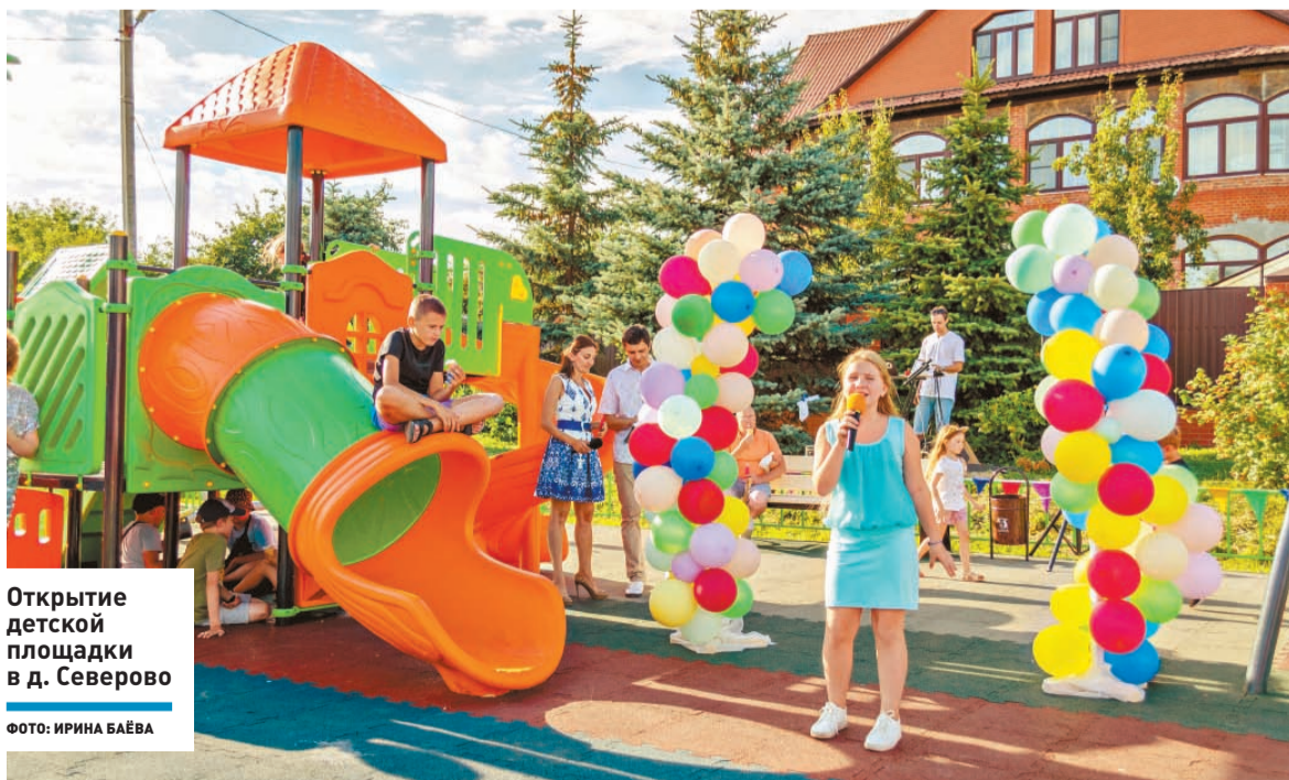
Открытие детской площадки в д. Северово

и зоны для активных занятий оборудуют в Большом Подольске в этом году