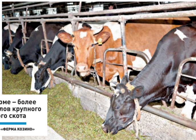
На ферме – более 700 голов крупного рогатого скота