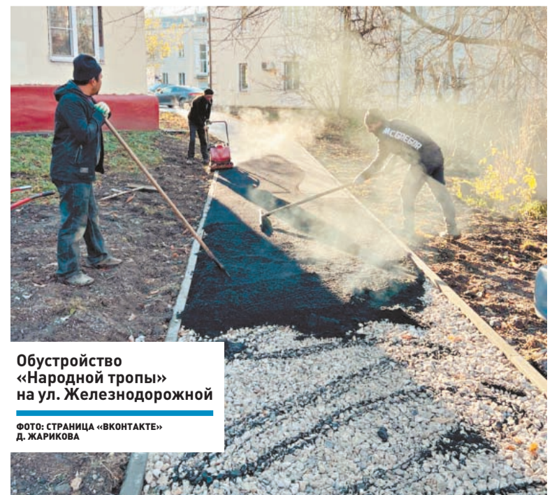
Обустройство «Народной тропы» на ул. Железнодорожной