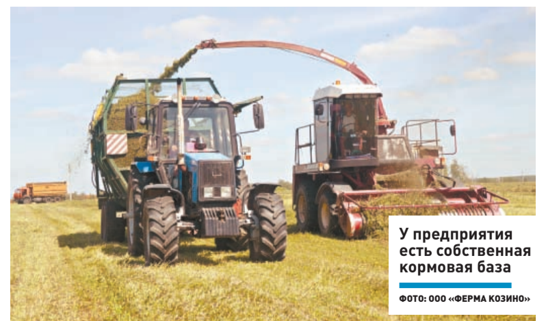
У предприятия есть собственная кормовая база

– Такие сыры являются скоропортящимися продуктами, сроки их реализации составляют не более 10 суток, – рассказал Эдуард Шипилов. – Мы изучили рынок спроса на этот продукт и планируем открыть в нашем городском округе фирменный магазин для продажи мягких сыров под торговой маркой «Экологически чистый продукт».