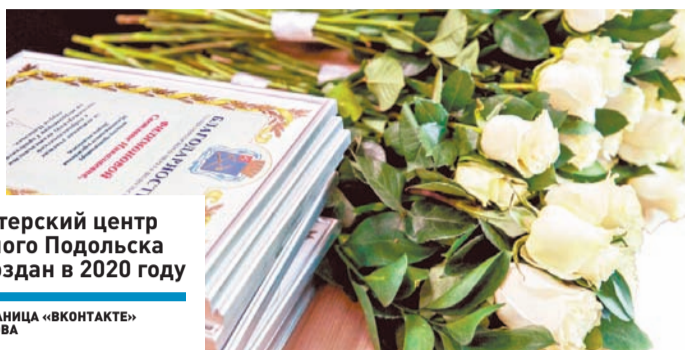
Волонтерский центр Большого Подольска был создан в 2020 году