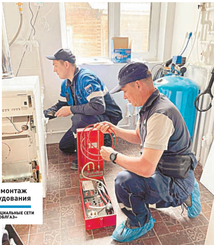
Идет монтаж оборудования

ЭНЕРГОРЕСУРСЫ ] В городском округе Подольск осталось догазифицировать 9 населенных пунктов