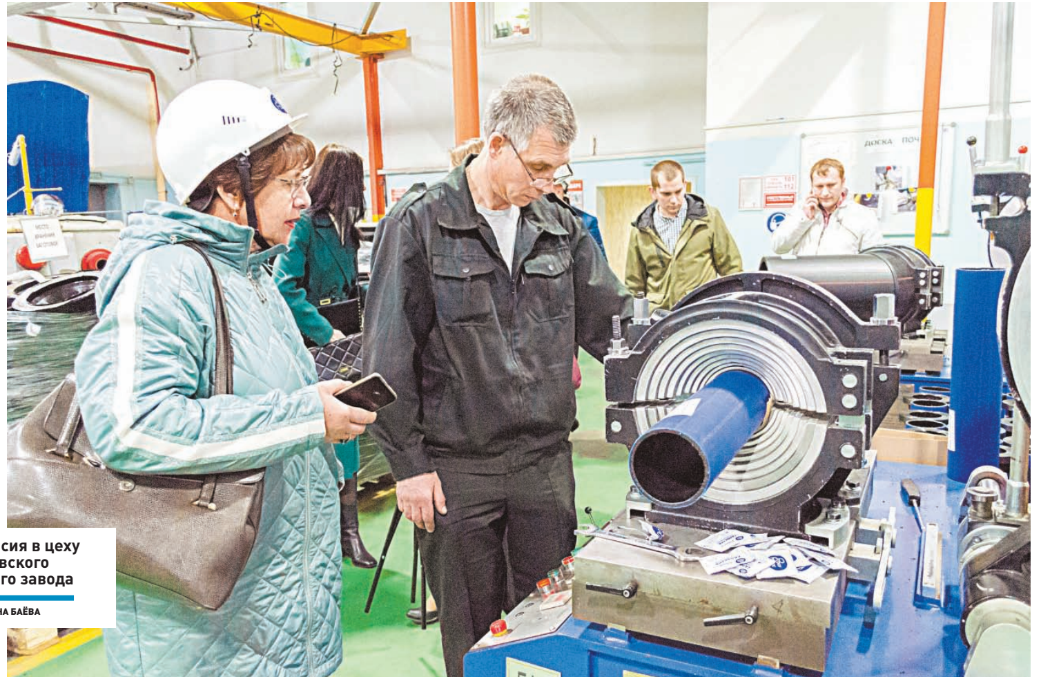
Экскурсия в цеху Климовского трубного завода

ПРЕДПРИНИМАТЕЛЬСТВО | Большой Подольск – одна из самых перспективных в Московской области территорий для ведения бизнеса