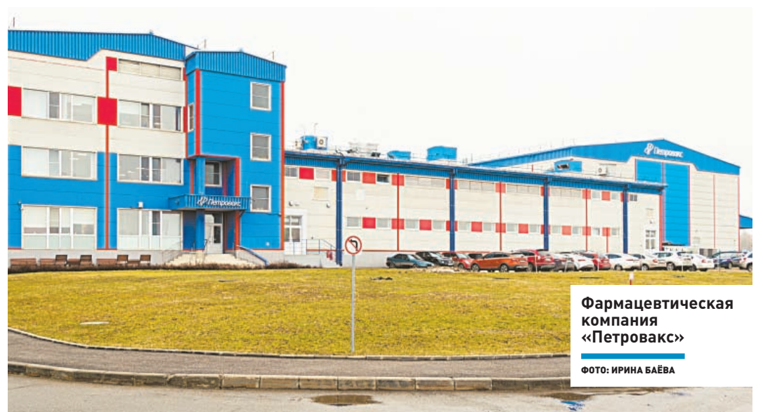
Фармацевтическая компания «Петровакс»