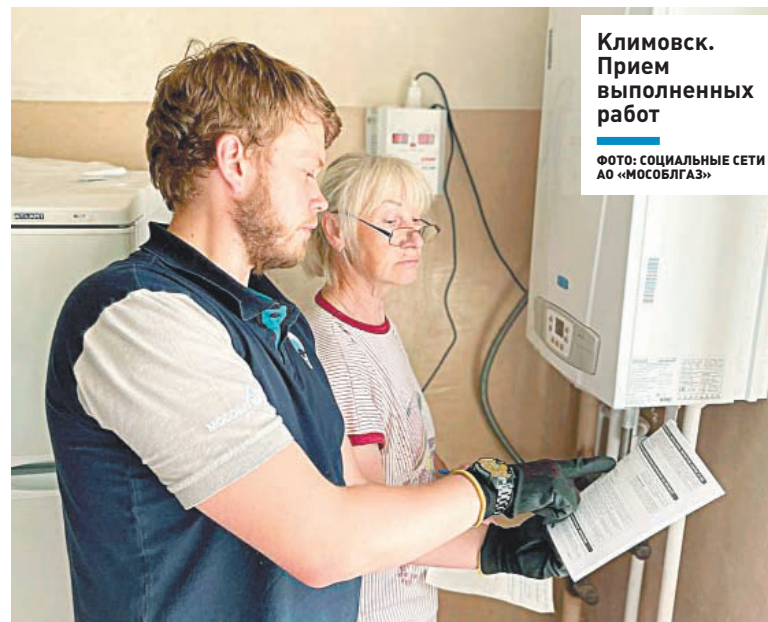
Климовск. Прием выполненных работ

– Дом отапливали с помощью электричества. Благодаря программе нам удалось подвести газ к дому намного дешевле. Очень легко подали заявку. Принесли необходимые документы в одно окно и дождались своей очереди.