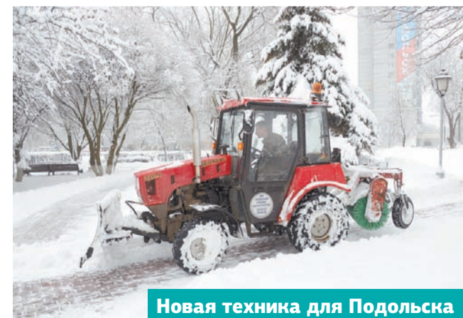
Новая техника для Подольска