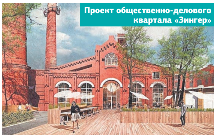
Проект общественно-делового квартала «Зингер»

Также было утверждено новое положение об Общественной палате городского округа Подольск и внесены изменения в положение о комитете по культуре и туризму администрации округа. Отметим, что формирование Общественной палаты Большого Подольска нового созыва завершилось 31 октября 2020 года. Она состоит из 45 членов, их срок полномочий – три года.