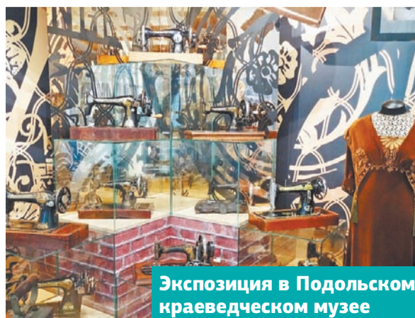
Экспозиция в Подольском краеведческом музее