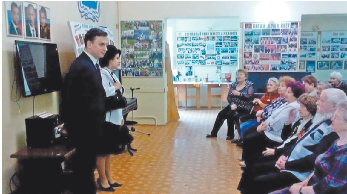
Александр Юрьевич поздравляет ветеранов с Днём Победы

За много лет работы я убедился: у многих формируется устойчивая точка зрения, что детей оставлять нельзя. Люди в большинстве своем не остаются равнодушными, когда видят сирот, понимают, что для ребенка