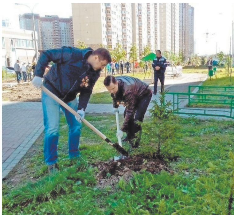
Акция «Лес Победы»