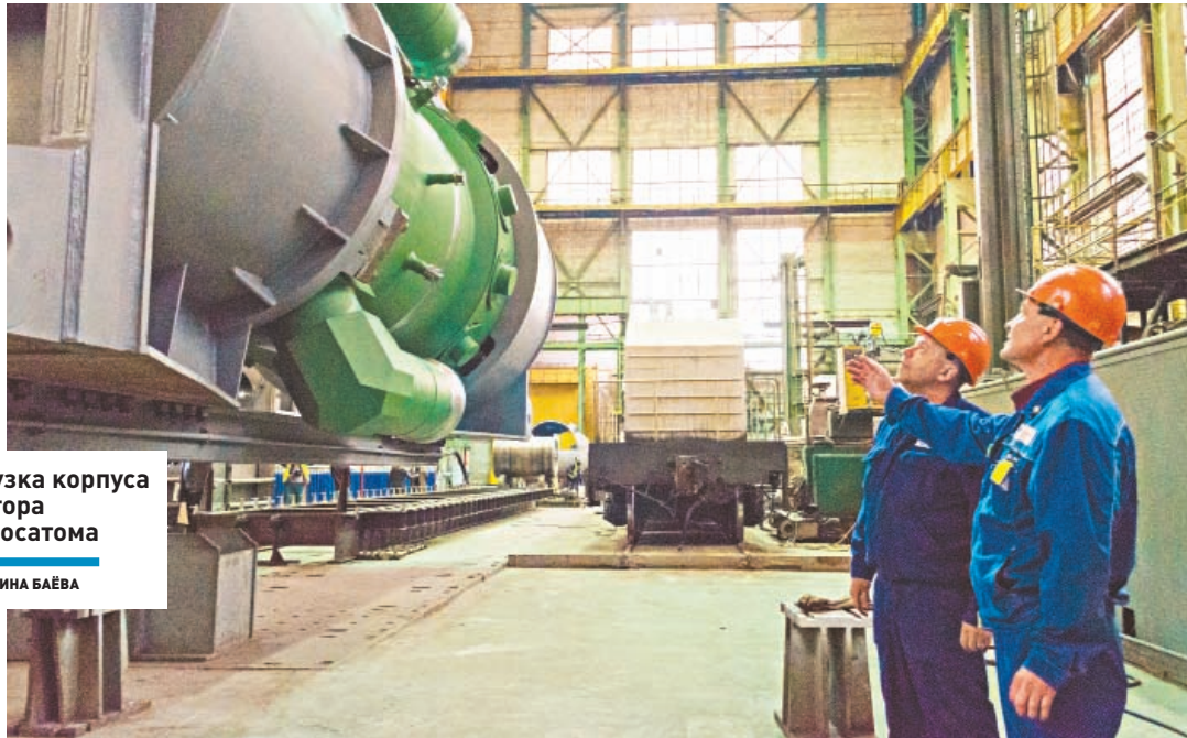
Погрузка корпуса реактора для Росатома

ДЕНЬГИ | Почти 156 тысяч человек задействованы в экономике городского округа Подольск