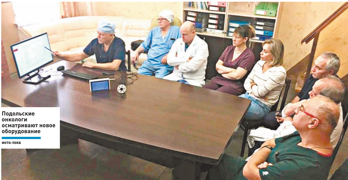
Подольские онкологи осматривают новое оборудование