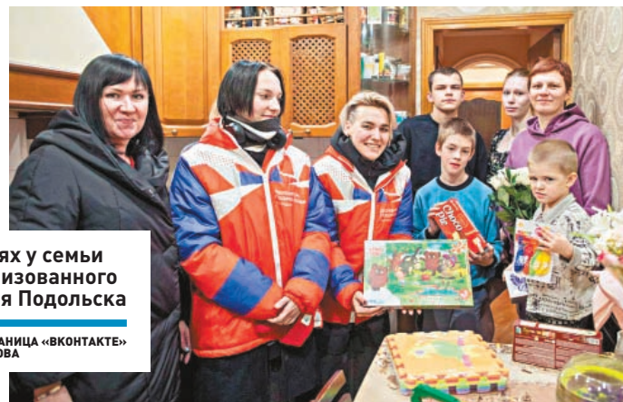
В гостях у семьи мобилизованного жителя Подольска

ПОДДЕРЖКА ] В Подмоскovie приступили к разработке порядка выдачи земли участникам СВО