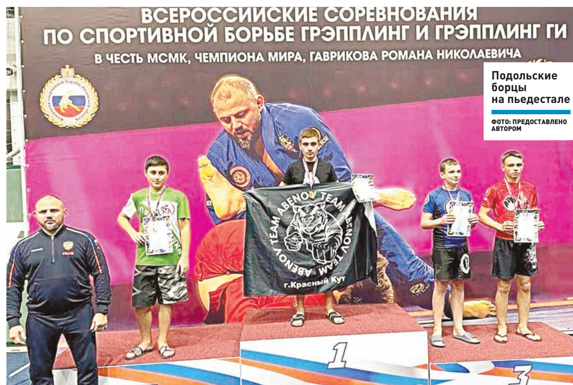
Подольские борцы на пьедестале