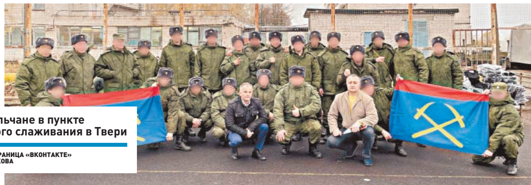
Подольчане в пункте боевого слаживания в Твери

Губернатор Московской области Андрей Воробьев сообщил, что власти региона с особым вниманием отнесутся к поручению президента. Он уже потребовал от профильных заводов разработать порядок, правила и условия предоставления таких объектов в собственность наших защитников.