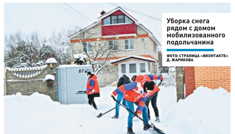
Уборка снега рядом с домом мобилизованного подольчанина