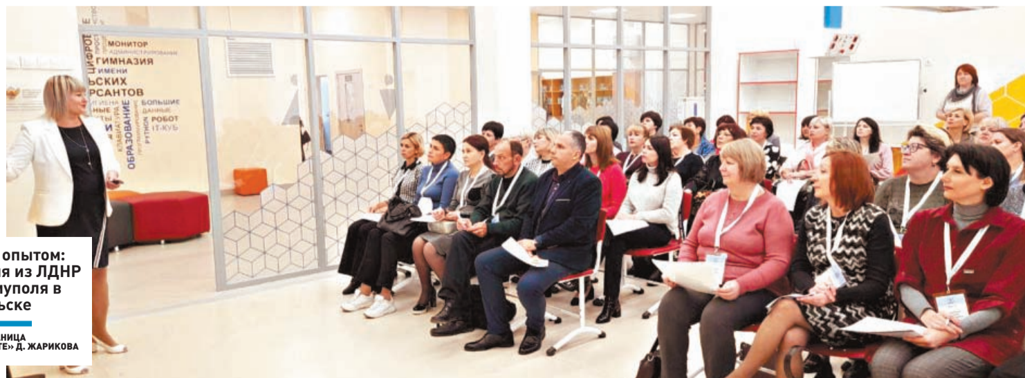
Обмен опытом: учителя из ЛДНР и Мариуполя в Подольске

Всего в Московской области работают 108 тысяч педагогов. Среди них 54 тысячи школьных учителей, 39 тысяч воспитателей в детских садах, 4 тысячи преподавателей в колледжах, 12 тысяч работников дополнительного образования.