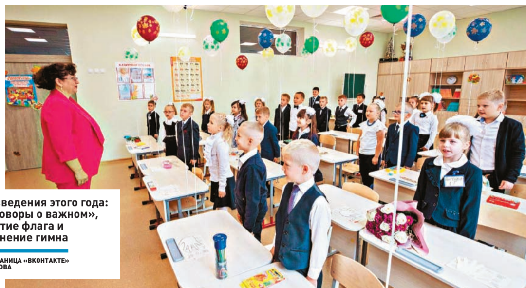
Нововведения этого года: «Разговоры о важном», поднятие флага и исполнение гимна

– Что касается качества образования, здесь важны и методика, и питание. Все то, что беспокоит родителей, беспокоит семью, – заявил Андрей Воробьев в ходе оперативного совещания.