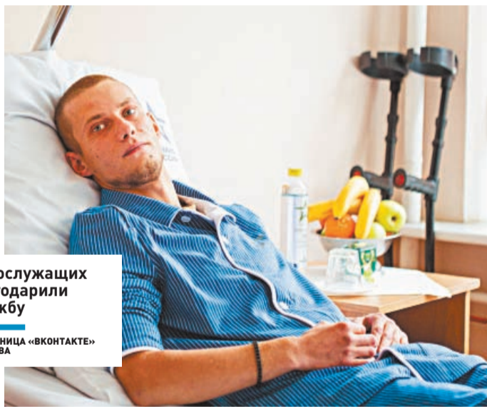
Военнослужащих поблагодарили за службу

ПРОФЕССИОНАЛЫ | Сотрудники военного госпиталя в Подольске наградили ко Дню города