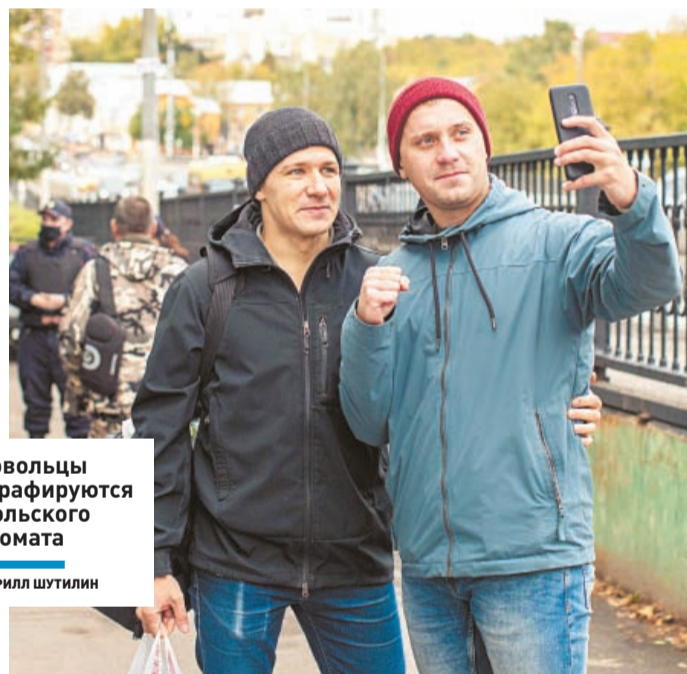
Добровольцы фотографируются у подольского военкомата