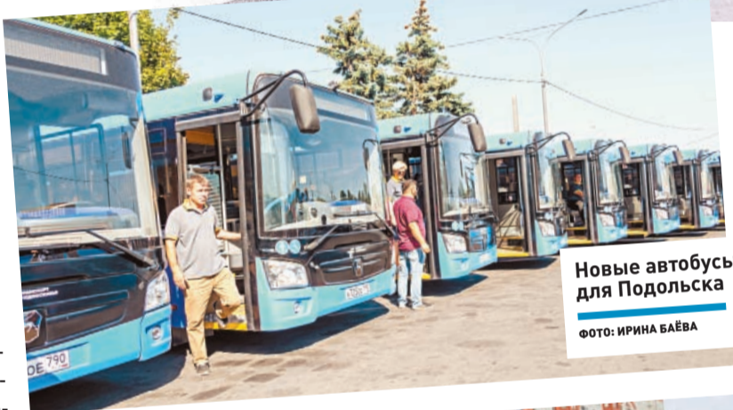
Новые автобусы для Подольска