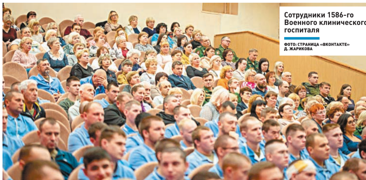
Сотрудники 1586-го Военного клинического госпиталя

Напомним, мобилизованные и добровольцы из Подмосковья, а также их семьи получают региональные меры поддержки, об этом сказал губернатор Московской области Андрей Воробьев, общаясь с бойцами из Подмосковья, которые сейчас проходят боевое слаживание в Тверской области. Областная единовременная выплата составит 200 тысяч рублей.