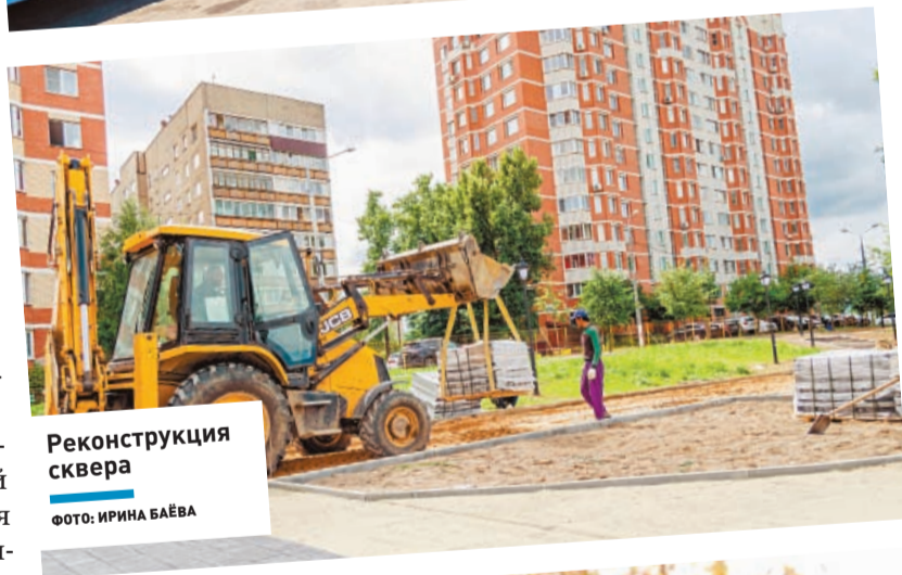
Реконструкция сквера