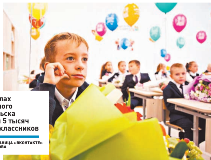
В школах Большого Подольска учатся 5 тысяч первоклассников

– МОСКОВСКАЯ ОБЛАСТЬ РАСТЕТ. Мы ремонтируем школы, строим новые, реализуем программу по привлечению учителей. Ищем самых талантливых учителей, которые дают хорошие результаты детям, чтобы они могли воплощать самые смелые мечты.