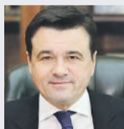
Андрей ВОРОБЬЕВ, губернатор Московской области: