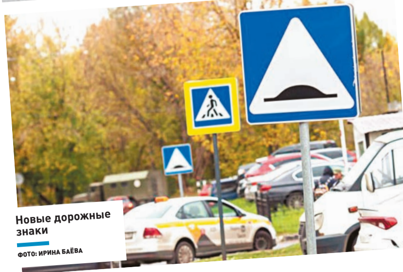
Новые дорожные знаки