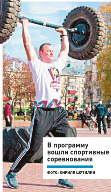
В программу вошли спортивные соревнования