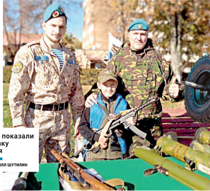
Гостям показали выставку оружия

АКЦИЯ | Более полутора тысяч жителей и гостей Подольска приняли участие в патриотическом фестивале «За Мир!»