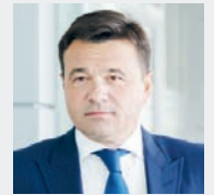
Андрей ВОРОБЬЁВ, губернатор Московской области:

Кроме того, предприниматель раскрыл некоторые планы на будущее. Компания намерена не только вернуть к работе все рестораны бывшей сети «Макдоналдс», но и развивать новые точки.