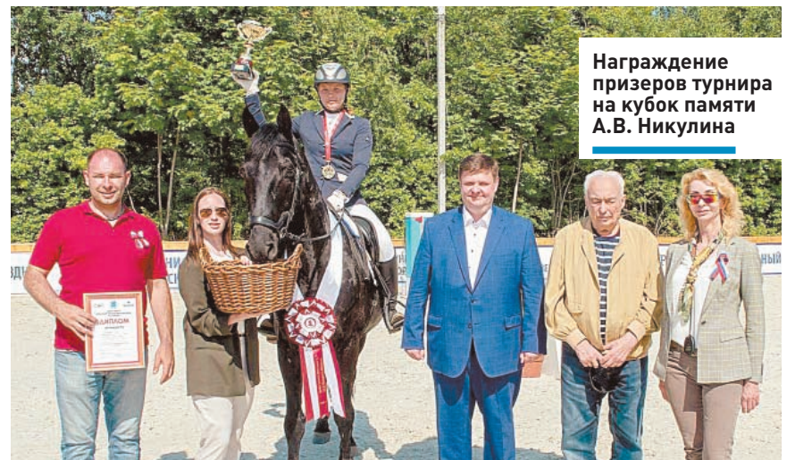
Награждение призеров турнира на кубок памяти А.В. Никулина