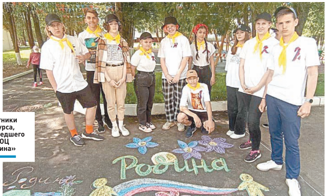
Участники конкурса, прошедшего в ДЮОЦ «Родина»