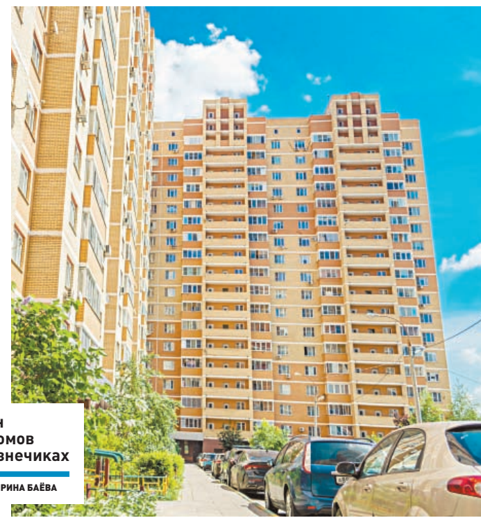
Один из домов в Кузнечиках

Здесь уже не возникнет ситуация, когда в квартире исчезнут вода и электричество, потому что дом за долги отрезан от коммуникаций, а счета УК заблокированы. Так что есть смысл задуматься: куда нести свои кровные? Ответ очевиден.