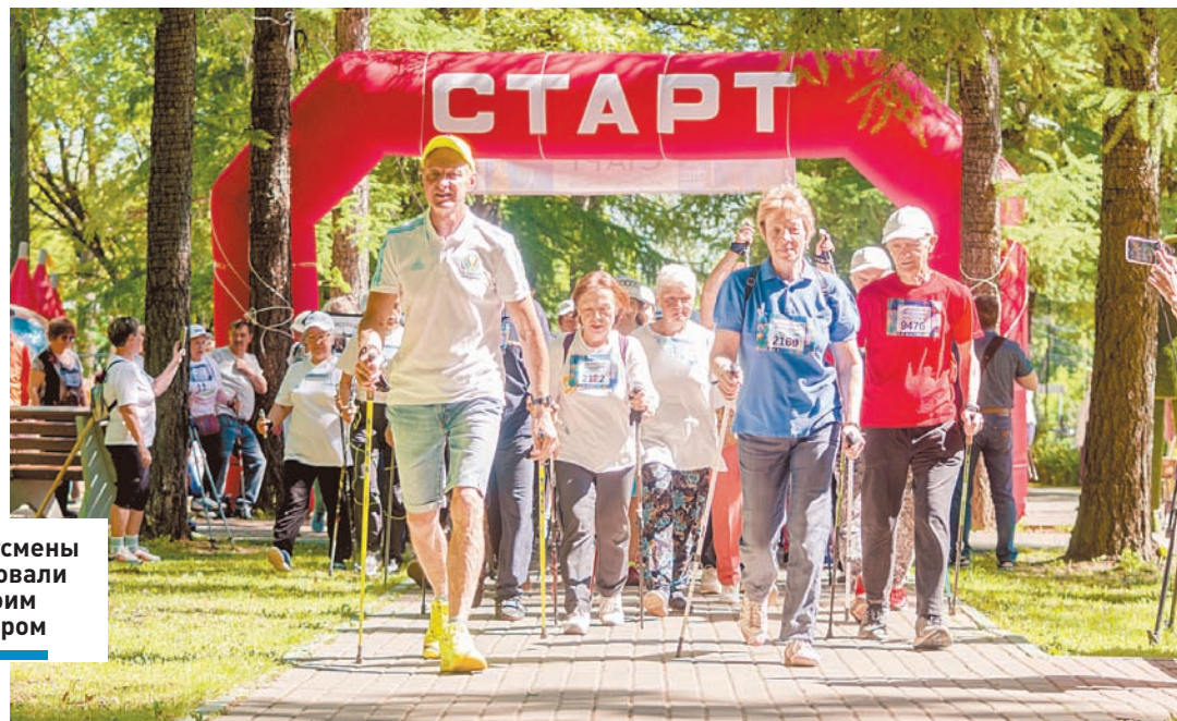
Спортсмены стартовали со своим тренером

АКТИВНОЕ ДОЛГОЛЕТИЕ ] Подольчане приняли участие в областном марафоне скандинавской ходьбы