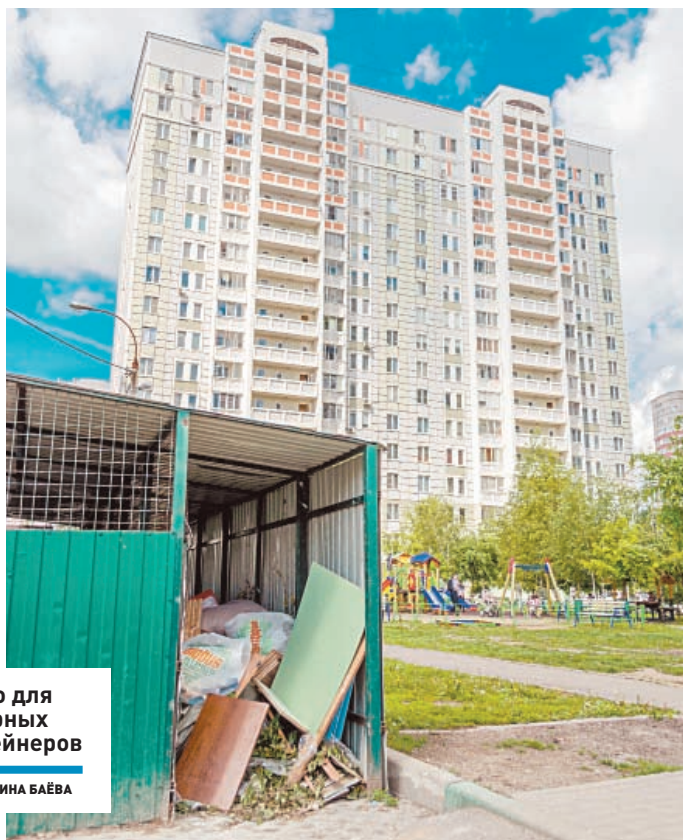
Место для мусорных контейнеров

СИТУАЦИЯ | Даже если вы исправно платите «коммуналку», все равно можете стать должником