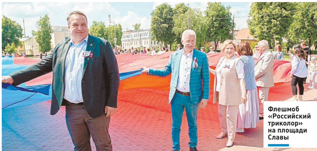
Флешмоб «Российский триколор» на площади Славы